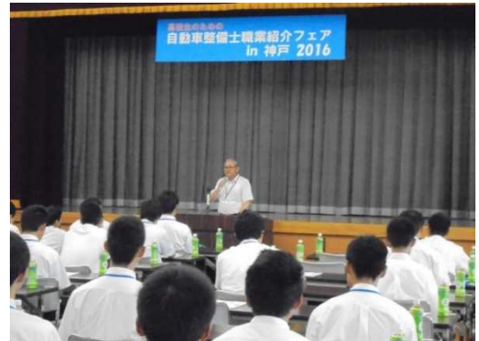
昨年のフェアのようす