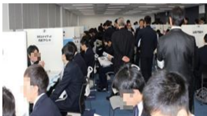
神戸ポートオアシスで開催した時のようす(2017年度・2021年度)