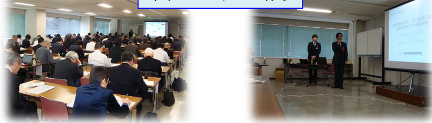
昨年のセミナーの様子