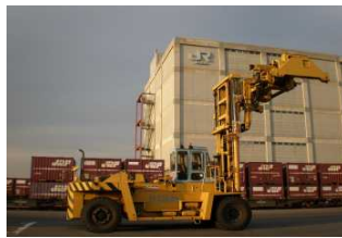
トップリフターによる作業