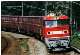
貨物列車

最寄の駅は、京阪電車・地下鉄谷町線「天満橋駅」です。 地下鉄をご利用の場合、3番出口から東方向(大阪城側)へ徒歩約2分です。