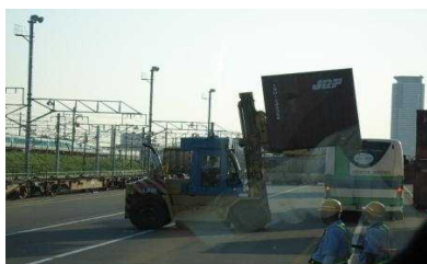
←コンテナ積み込み作業（イメージ）