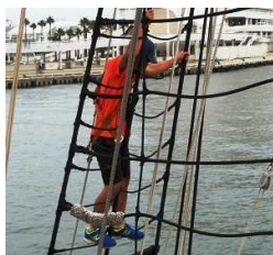
過去の海洋教室の様子

【保 険】 船客賠償責任保険 (船客賠償 (死亡・後遺障害 1 億円) 他)、 国内旅行傷害保険 (死亡 500 万、入院 3 千円/日、通院 2 千円/日 他) に加入