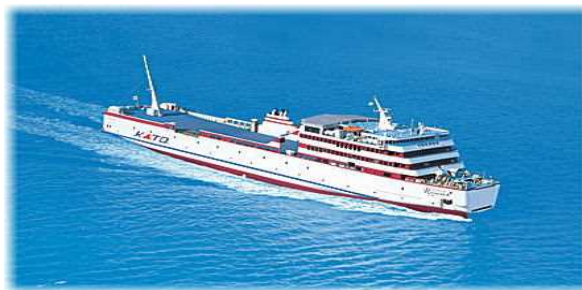
神戸～小豆島～高松間フェリー ジャンボフェリー (株)