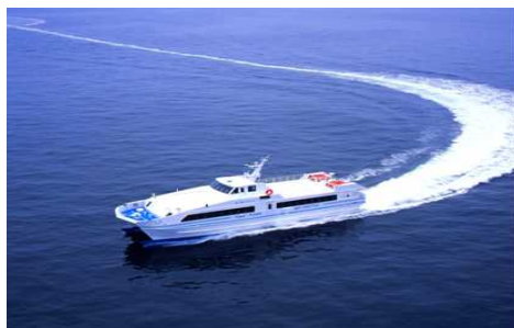
神戸-関空バイ・シャトル (株) OMこうべ

今般、夏のシーズンが始まるに当たり、運航労務監理官などが実際に訪船し、事業者の安全管理体制の確認・安全点検の実施を行うとともに、安全に係る注意喚起を行い、船舶乗組員及び運航管理責任者の安全意識の向上を図ります。