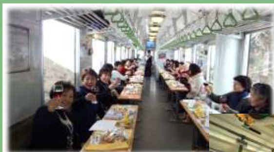
女子会“ほろ酔い”列車