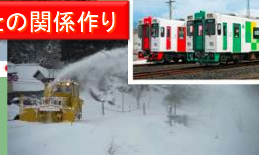
TV東京 日曜ビッグバラエティ