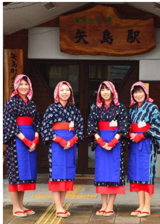
列車アテンダント