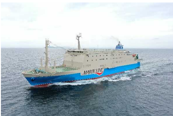
クイーンコーラルクロス(鹿児島～那覇航路)