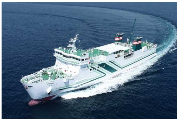
うみてらし(博多～比田勝航路)