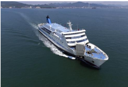
はまゆう(下関～釜山航路)