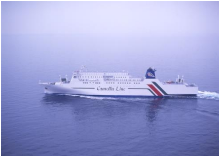
ニューかめりあ(博多～釜山航路)

博多・対馬・下関と韓国の釜山を結ぶ日韓航路は、令和4年度、約5万7千人の利用がありました。令和5年5月に新型コロナウイルスの感染症法上の位置づけが5類に移行したことで、規制が大きく緩和されたことから、今後利用者の増加が期待されています。