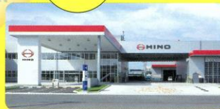
南九州日野自動車(株)