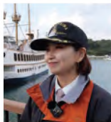
(再生時間 / 20分32秒)

九十九島を舞台に「海の女王」を イメージした遊覧船を操り、 国内外のお客様に クルーズの魅力と感動を 届けている女性船長の 仕事に密着