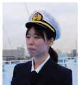
(再生時間 / 20分13秒)

九州「新門司港」から 大阪「泉大津港」まで瀬戸内海を 約460km、夕方の積荷役から、 出港準備、航海当直、 翌日の点検業務までの 女性航海士の仕事に密着