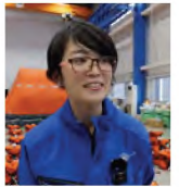
(再生時間 / 19分08秒)

国内最大級の整備場の広さと 設備を誇るサービスステーション で、専門的な技術、きめ細かさ、 気づき、周囲への配慮など チームからも高い評価を 得ている女性整備士の 仕事に密着