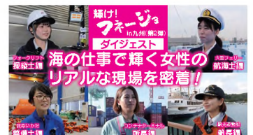
(再生時間 / 5分15秒)

「フネージョ」とは、イタリア語の「アダージョ」 (「くつろぐ」「ゆっくり」と等の意)の語感を含め、 船員や造船・船用工業など海事分野で働く 女性を象徴した造語。