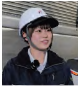
(再生時間 / 17分47秒)

食品メーカー5社が出資する 全国規模の物流合併会社 入社約8ヶ月にして 自在にフォークリフトを操る 若き女性操縦士の仕事に密着