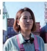
(再生時間 / 19分13秒)

世界中のコンテナ船が寄港する 熊本県最大の国際貿易港「八代港」 港湾の花形「ガントリークレーン」 の資格有し、港湾管理運営を行う 女性所長の仕事に密着