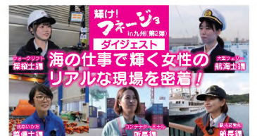
(再生時間 / 5分15秒)

「フネージョ」とは、イタリア語の「アダージョ」 (「くつろぐ」「ゆっくり」と等の意)の語感を込め、 船員や造船・船用工業など海事分野で働く 女性を象徴した造語。