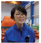
(再生時間 / 19分08秒)

国内最大級の整備場の広さと 設備を誇るサービスステーション で、専門的な技術、きめ細かさ、 気づき、周囲への配慮など チームからも高い評価を 得ている女性整備士の 仕事に密着