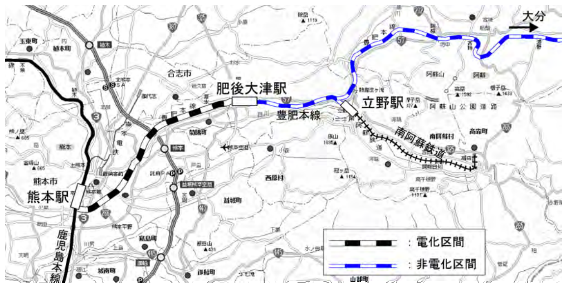
図 豊肥本線位置図