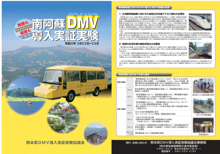
図 リーフレットデザイン（表）