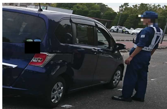
無車検車両ドライバーへ直接指導