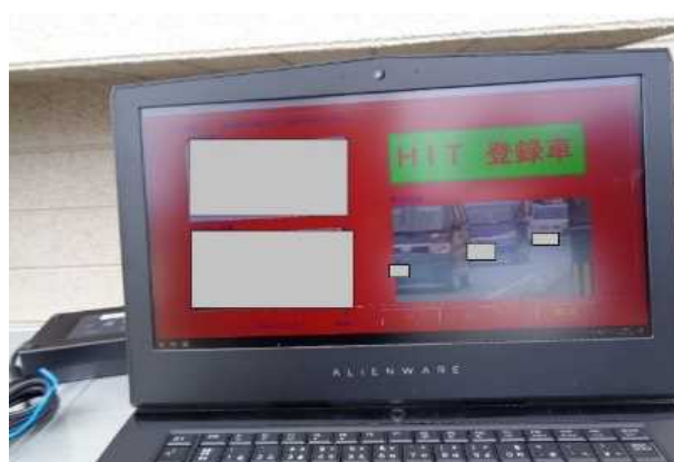
無車検車両発見時の端末画面