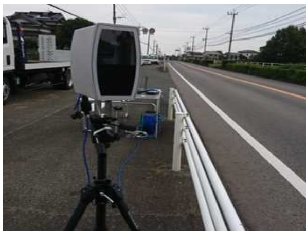
カメラでナンバーを読み取る

可搬式カメラを導入した街頭検査を実施しました ～車検切れ・自賠責保険切れの状態で運行している車両を特定～