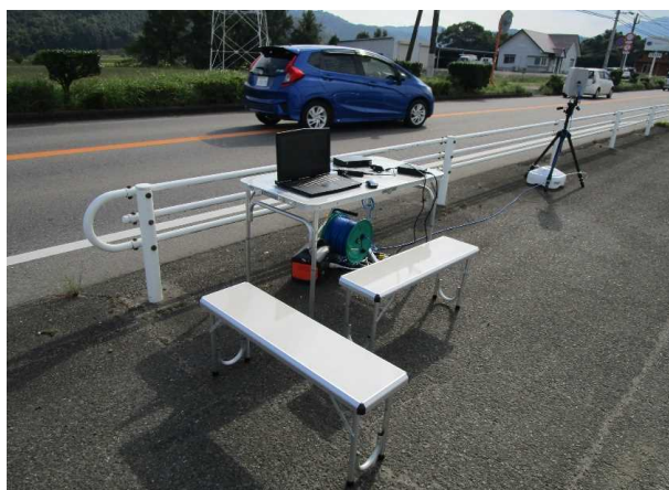
可搬式カメラ読取装置一式