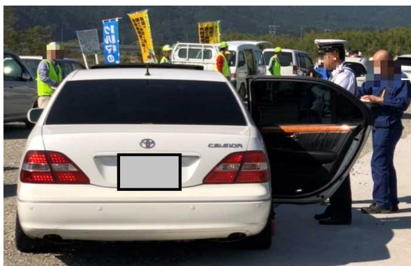
無車検車両ドライバーへ直接指導