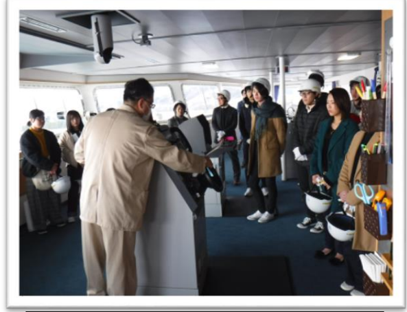
船橋で機器類の操作説明を受ける