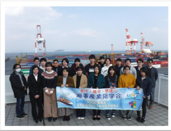
コンテナヤードをバックに