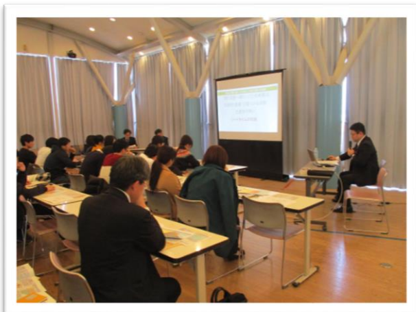
物流講座 国際フェリー輸送について