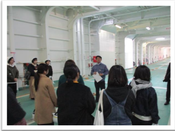
車両甲板で輸送能力の説明