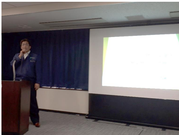
事業者の事例発表（関係者が一丸となって取り組む！）