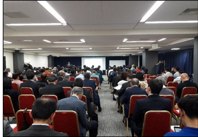
130名を越す来場者で関心の高さが窺えました