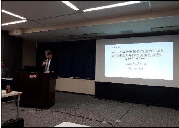
福田自動車局審議官の挨拶

「荷主と運送事業者の協力による取引環境と長時間労働の改善に向けたセミナー」が開催されました ～安定的・継続的な提供を可能とするために～