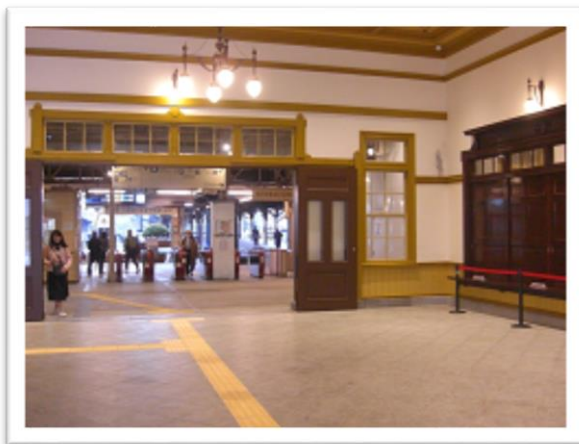
レトロ調の駅舎内部