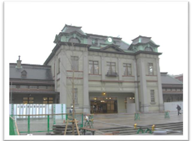
工事中の壁が残る駅舎