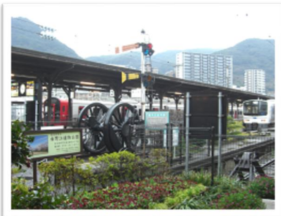
腕木式信号機と動輪