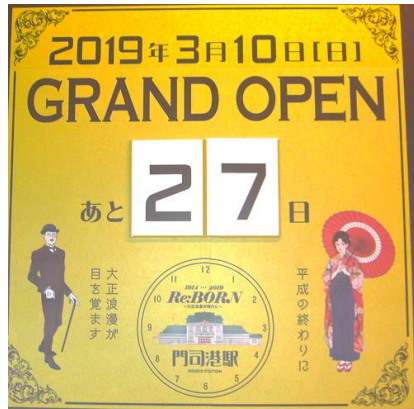
駅に置かれたカウントダウンボード