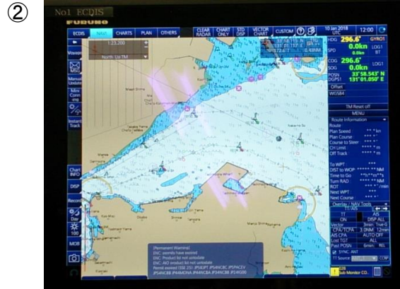
○ECDISは、自船位置を表示し、各種センサーのデータ(針路、速力、AIS等)を統合表示することが可能です