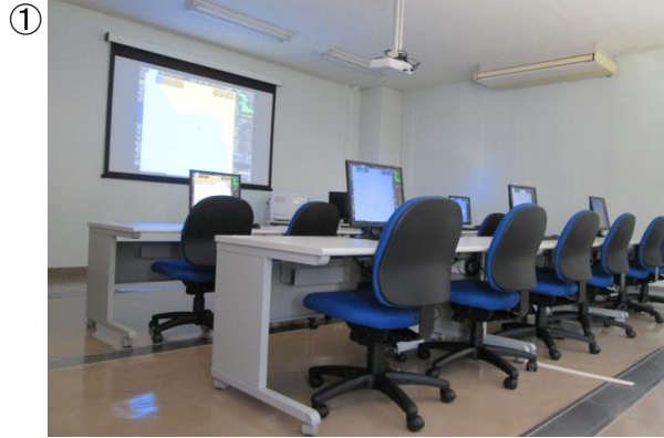
○ECDIS実習室 (1講習で12人の受講が可能です)