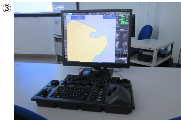
○受講生が操作する「ECDIS実機」