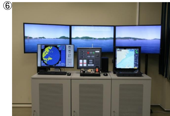
○操船シミュレータ (実海域を設定し模擬操船を行います)