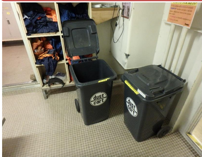
乗組員の洗濯物はランドリーマンという専門の方が行います