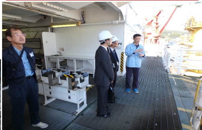
海底調査の最前線で働く方いわく、仕事上の 難しさは「実際に掘ってみたいとわからない」との事