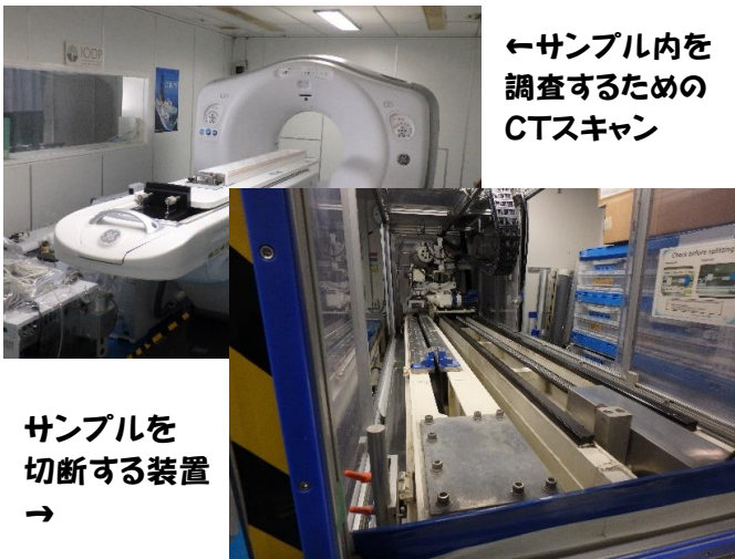
←サンプル内を 調査するための CTスキャン