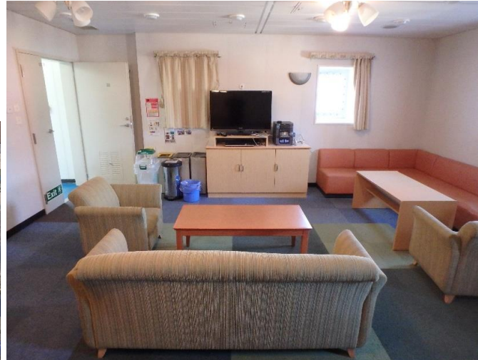
船員のくつろぎの場、広くて過ごしやすそうです