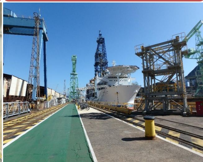
地球の謎を解明する特殊な船にも船員法!!