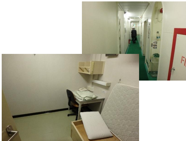
船員の居住区...一人部屋です。(二人部屋もあり)