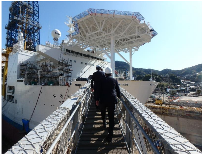
大きくせり出したヘリポートが目を引きます

船員法は船員の労働保護や船の安全運航の目的で様々な船舶に適用されます。地球深部探査船「ちきゅう」は、人類史上初めてマントルや巨大地震発生域への大深度掘削が可能な科学調査船です。このような特殊な船でも船員法が適用されます。この度、佐世保で「ちきゅう」の雇入雇止業務をの手續きを行った関係で「ちきゅう」について船の紹介がありました。