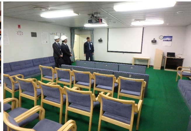
プロジェクター関係設備のあるミーティングルーム! 船員への安全意識を向上させる目的で使用されます