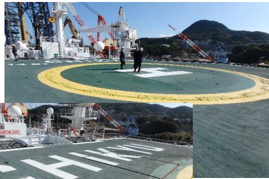
ヘリポート上には「CHIKYU」の文字が