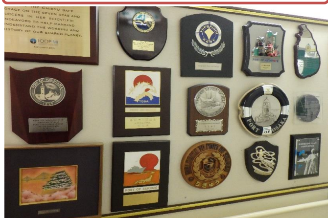
船内に啓示された入港記念の数々