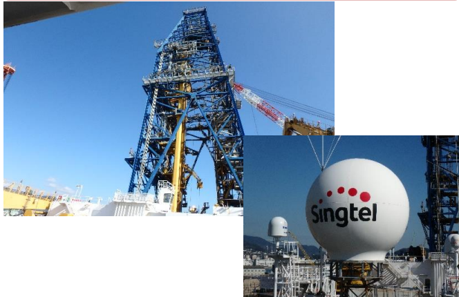
海底を掘るドリルフロアより伸びる巨大なやぐら 手前の画像のものはインターネットの設備だそうです