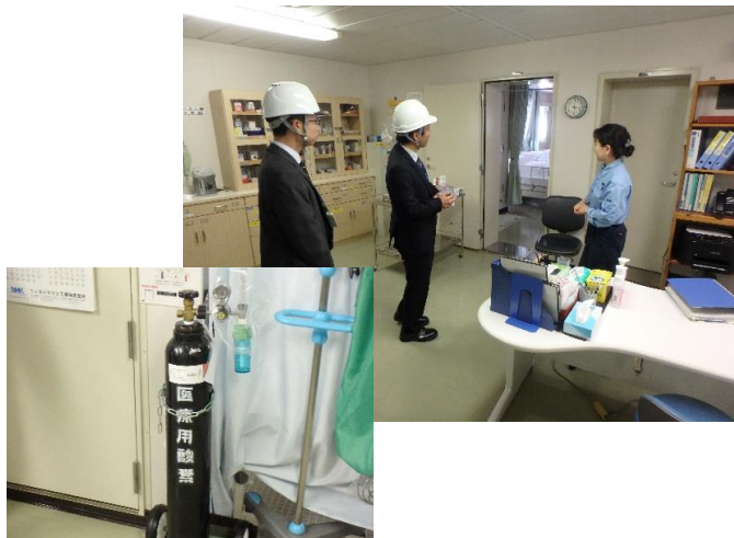
医務室には医療設備が整っており緊急時のボンベまで!