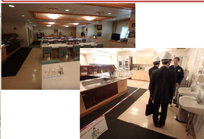
ゆったりとした食堂には仕切りが作られ、手洗い促進!