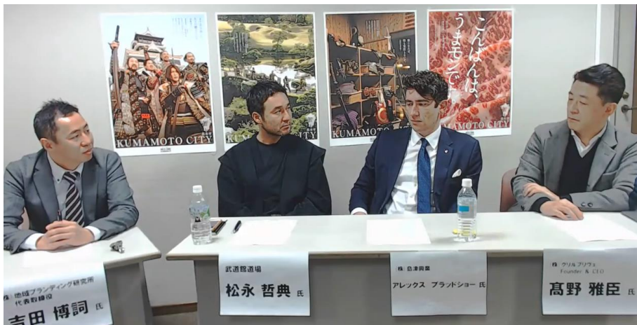
熊本の侍文化を生かしたターゲティング・連携戦略について議論するパネラーの皆様