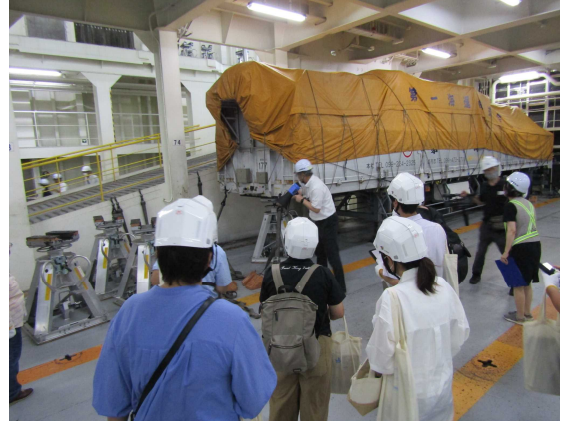
船内見学「HAKKOひなた」 車両甲板①