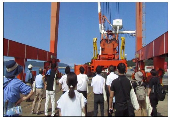
国際コンテナターミナル ガントリークレーン