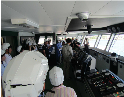
船内見学「HAKKOひなた」 船橋(ブリッジ)