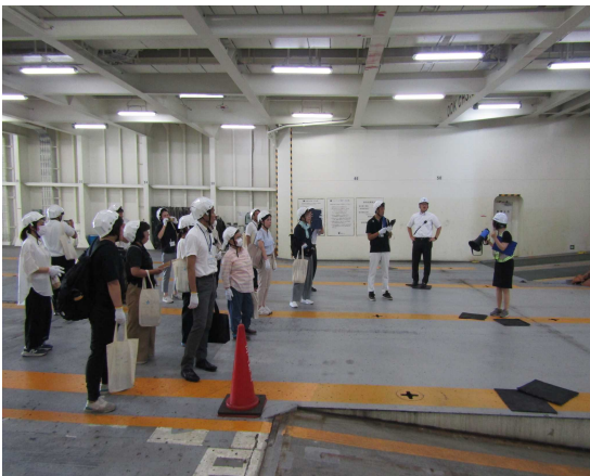
船内見学「HAKKOひなた」 車両甲板②