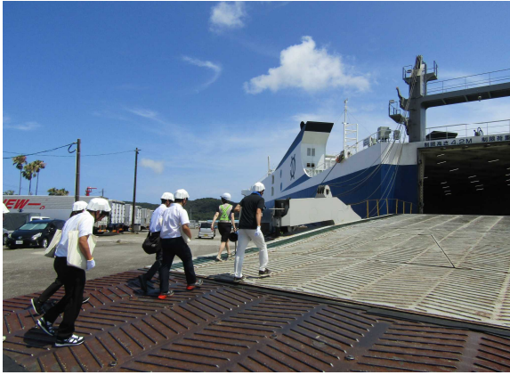
RORO船「HAKKOひなた」 に乗り込む先生方

宮崎運輸支局は7月25日(火)、日向市細島港において、 小学校教諭(22名)を対象にした「海事施設見学会」を実施しました。