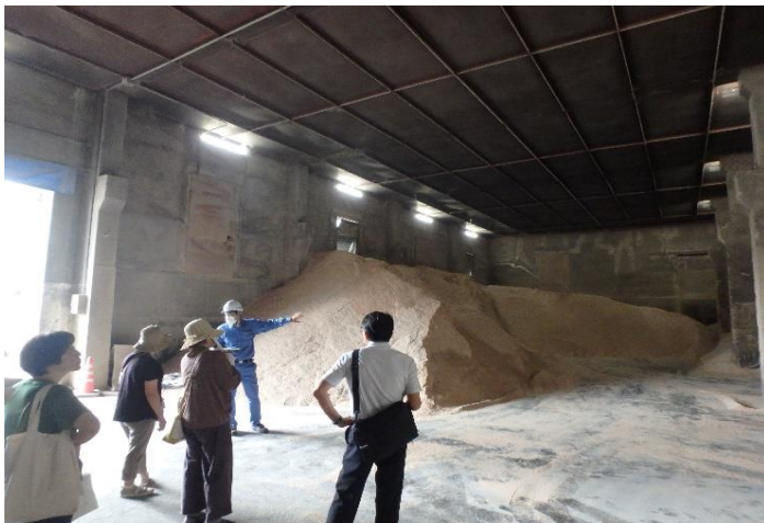
保管中の「ふすま(小麦粉の副産物)」を見学