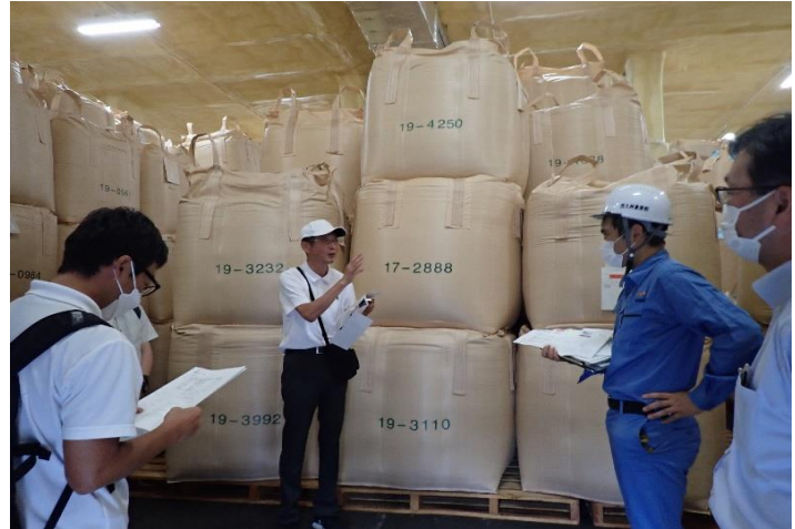
保管されている米について質問！