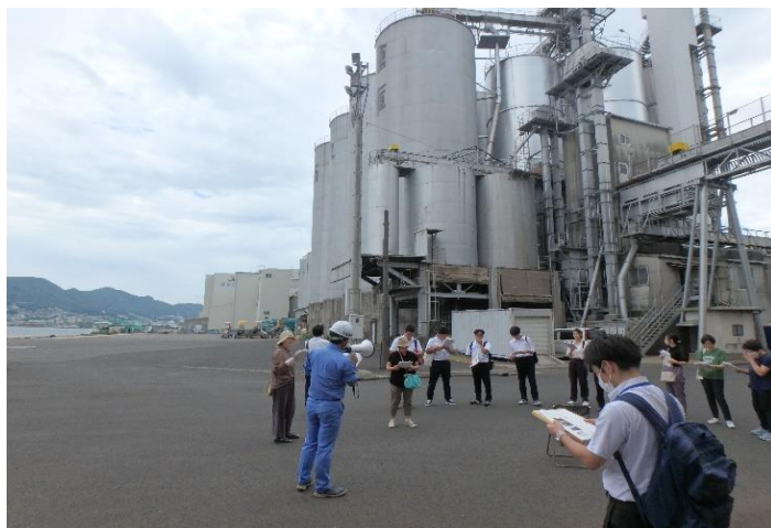
サイロ倉庫について学習中