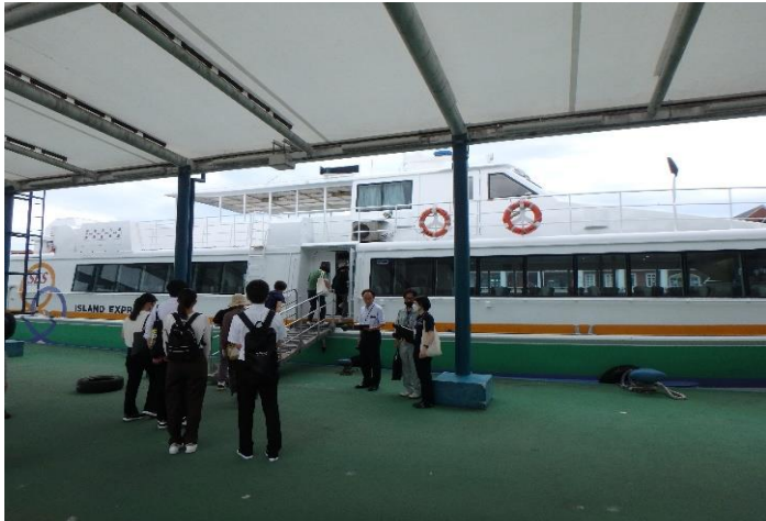
佐世保港内クルーズへ出発！

参加者からは、「普段知らない佐世保港の様子について知ることができて良かった」、「実体験を伴った学習ができた」といった感想がありました。