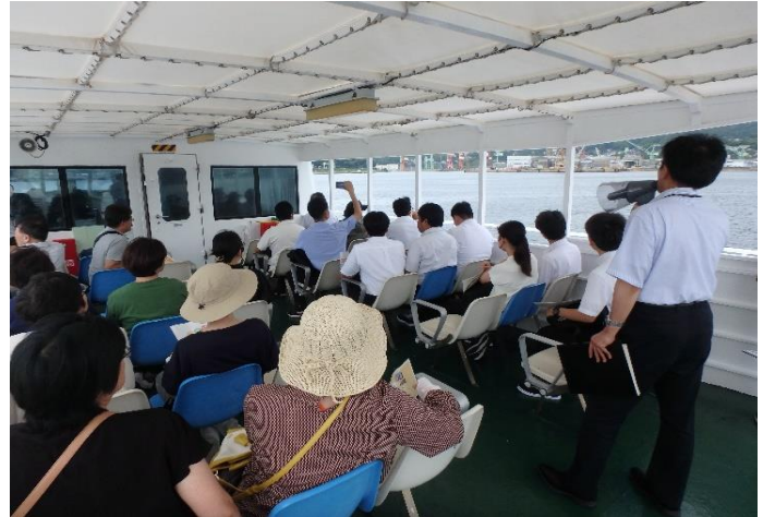
佐世保港内の各施設を見学