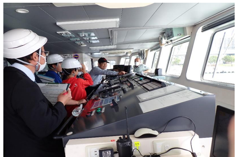
フェリーのブリッジの機器について学習中