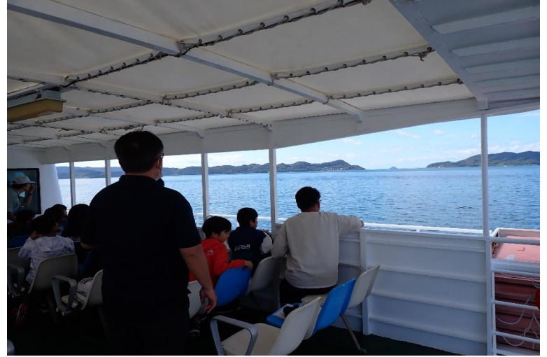
佐世保湾の入口を見学