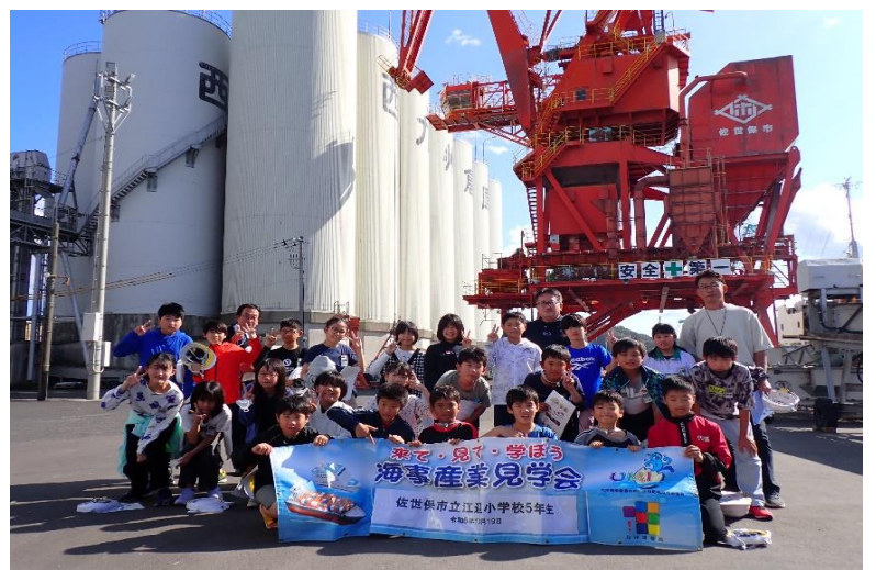
サイロ倉庫とクレーンの前で集合写真