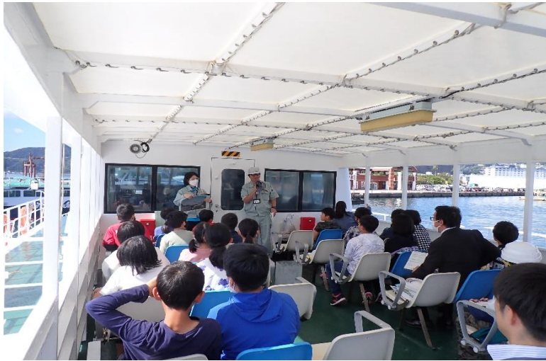
佐世保港内クルーズへ出発！