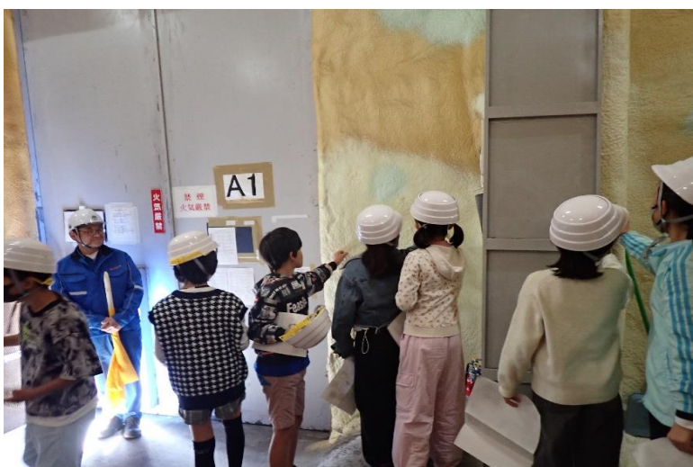
定温倉庫の断熱材に興味津々