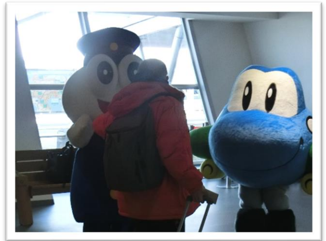
ゆるキャラも周知しました