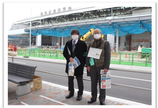
外国語の看板をぶらさげて周知