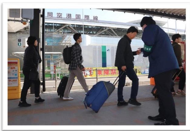
チラシと一緒に白タク排除を周知