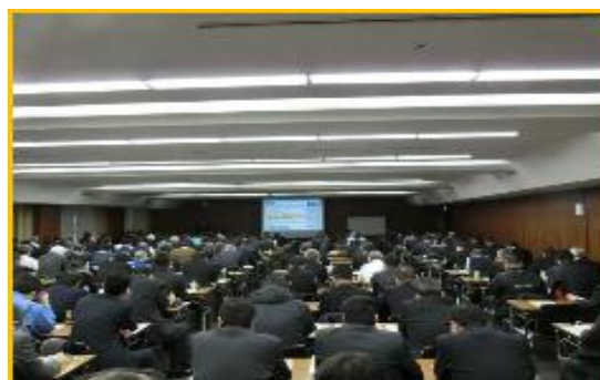
昨年の様子（福岡商工会館にて）