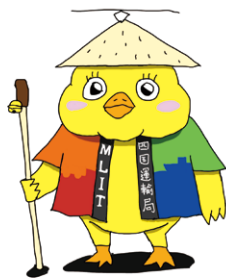
四国運輸局公式マスコットキャラクター 「びよんちゃん」

● 四国運輸局(本局) ◆ 運輸支局(本庁舎) ◇ 運輸支局(分庁舎) ○ 海事事務所