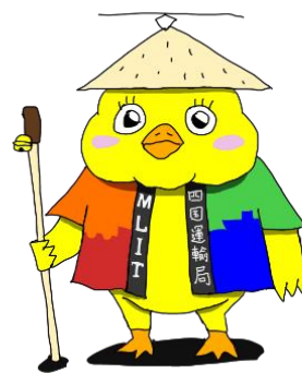
四国運輸局オフィシャル マスコットキャラクター 「ぴよんちゃん」