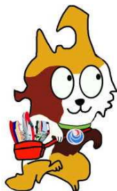
東北運輸局マスコット “とうほくろっ犬”

運賃適用地域における事業者数 15者 // 車両台数 595台 (平成30年5月22日現在)