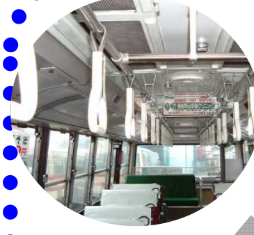
④吊革の高さ・ にぎり棒