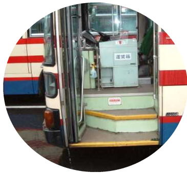
⑧降車時の車高・ ステップ段差