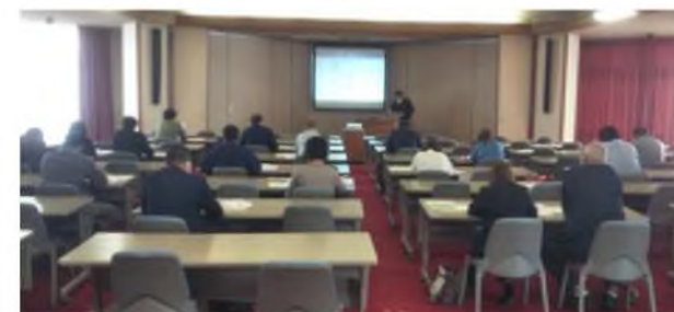
説明会会場の様子