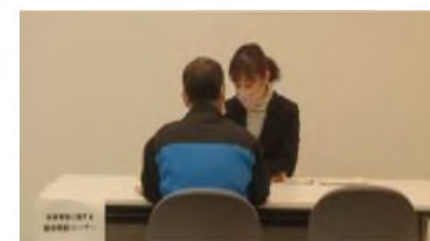
支援センターのスタッフ（写真奥）による個別相談