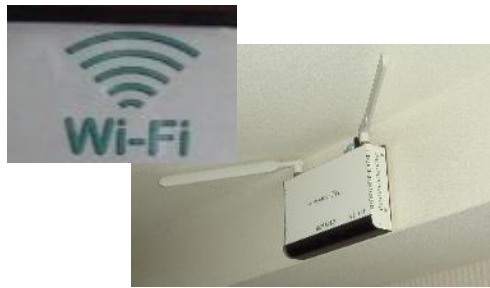
無料公衆無線LAN環境整備