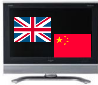
国際放送設備の整備