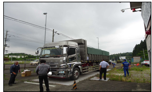
福島県内における街頭検査