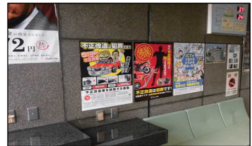
ポスターによる広報