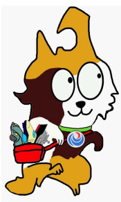
東北運輸局マスコット “とうほくろっ犬”

また、現地には駐車場はございませんので、車でお越しの際は近隣の有料駐車場に駐車いただくか公共交通機関等を利用してお越し願ひします。