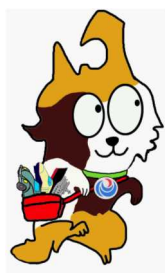
東北運輸局マスコット “とうほくろっ犬”

(注) 国土交通省で公表している「東北ブロック」の数値は、青森・岩手・宮城・福島の4県分であり、秋田・山形県分は「羽越ブロック」に含まれています。