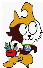
東北運輸局マスコット 「どうほくろっ犬」

国土交通省では、自動車ユーザーの手続に係る利便向上を図るため、OSS(※別添参照)を、平成17年12月より東京都等で開始し、東北運輸局管内でも、平成19年1月から岩手県において新車新規登録に係るサービスが提供されています。平成30年1月から秋田県、福島県、2月から宮城県、5月から青森県においてもサービスの提供が始まり、山形県でも今後OSSの導入が予定されています。