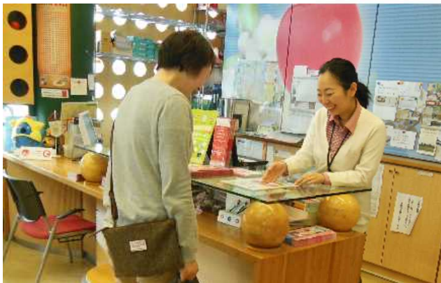
弘前市観光案内所の手ぶら観光カウンター