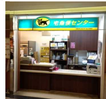
エスパル仙台の手ぶら観光カウンター