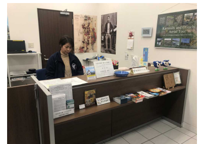
▲釜石手ぶら観光カウンター