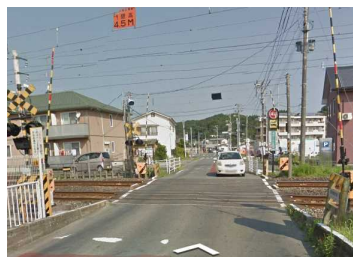
自動車練習所踏切