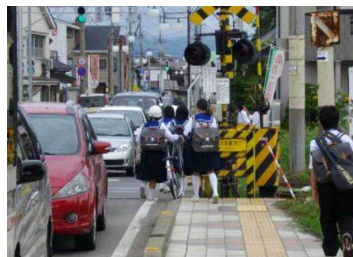
第4喜多方街道踏切