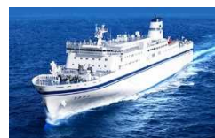
一般旅客定期航路事業者