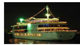
旅客不定期航路事業者 (遊覧船等)