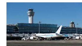
航空旅客ターミナル管理者