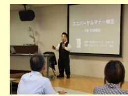
当事者講師によるセミナー