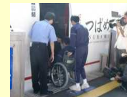
車椅子サポート体験