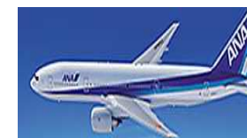
本邦航空運送事業者