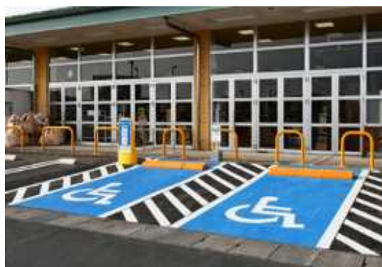
(車椅子使用者用駐車施設)