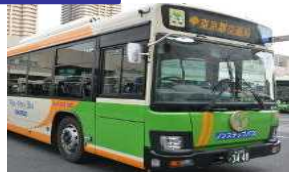
路線バス事業者(定期運行)