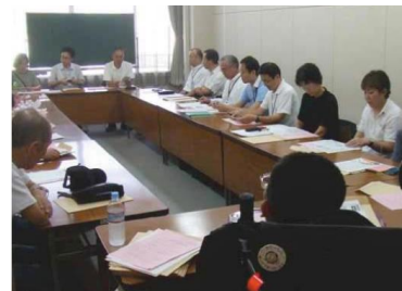
土浦市の担当者も参加した勉強会

土浦市からのアドバイス 「住民提案の動きがある団体の情報があつた際には、積極的に協働し提案提出につなげることで、ニーズを早期に把握するとともに、自治体の政策にある程度沿った提案につなげることができると思います。」