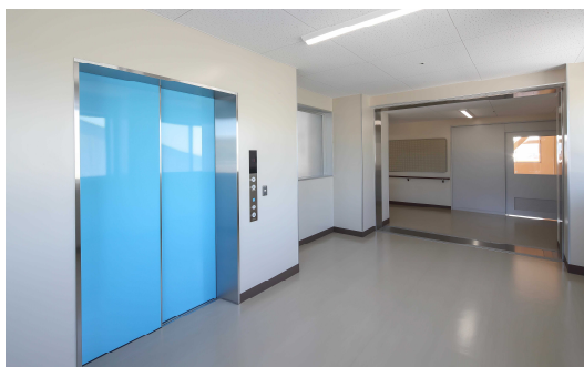
エレベーターの設置

エレベーターの設置、分かりやすい案内、トイレの改善、段差の解消等、誰もが利用しやすいように整備、改修。2021年には、再編整備により廃校となった高校の校舎をユニバーサルデザインに配慮した施設に改修し、浜松みをつくし特別支援学校として開校。