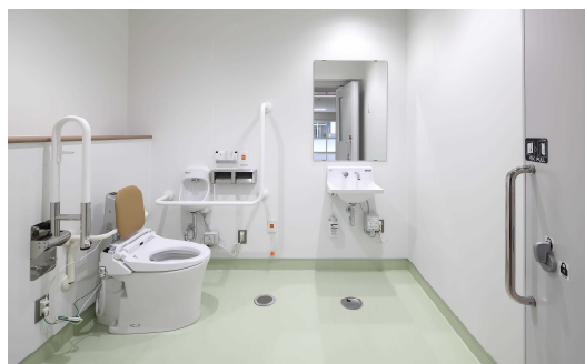
多目的トイレの整備