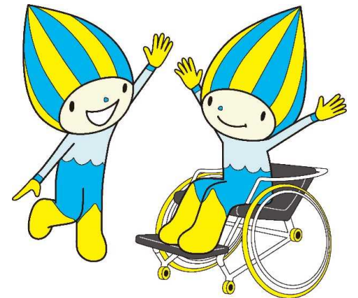
岐阜県マスコットキャラクター「ミナモ」