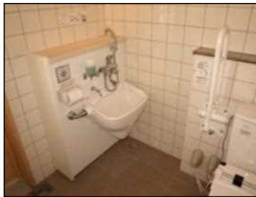
バリアフリートイレの整備