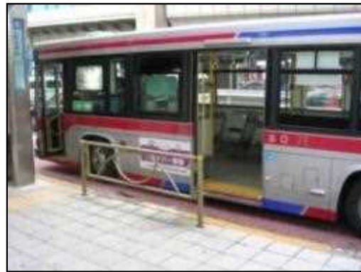
ノンステップバスの導入