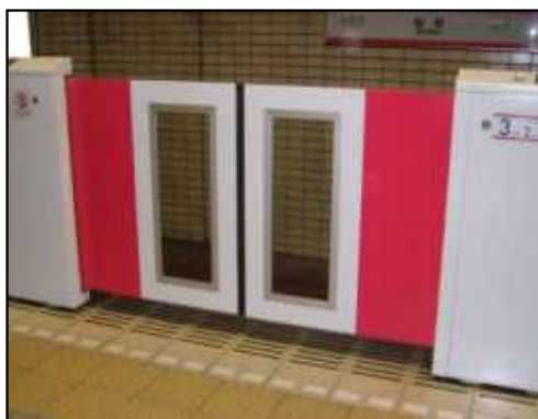
ホームドアの設置

※2 計画に盛り込むべき項目:施設整備、役務提供、旅客支援、情報提供、教育訓練、広報・啓発