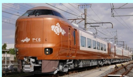
②設計段階から障害当事者の意見を踏まえた新型特急車両の開発