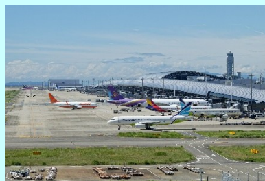
②多様な当事者と空港職員による建設的対話から成し遂げた関西エアポートのバリアフリー化

※過去の受賞案件については、国土交通省ホームページ（ https://www.mlit.go.jp/sogoseisaku/barrierfree/sosei_barrierfree_tk_000001.html ）でご案内しています。