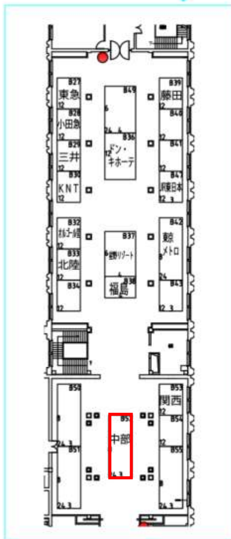
出展団体リスト(位置確定分)