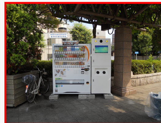
横須賀市役所前公園