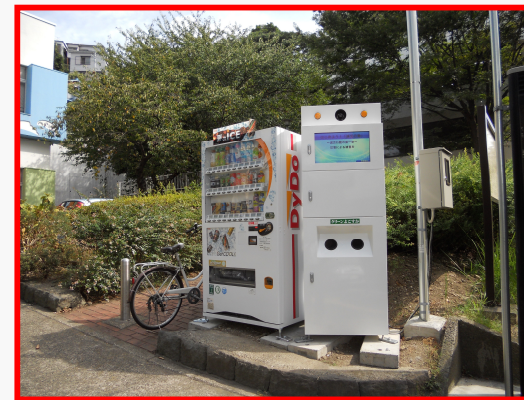
横須賀市平坂公園