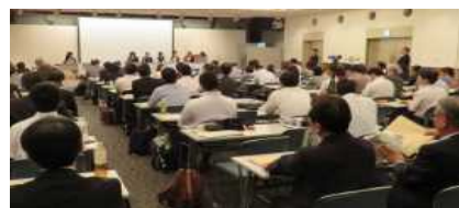
女性ドライバーによるパネルディスカッション