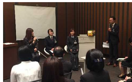
女性乗務員トークセッション