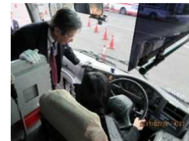
大型バス運転体験