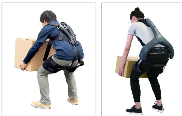
腰補助用アシストスーツ (左：空気圧パワー型、右：電動パワー型)