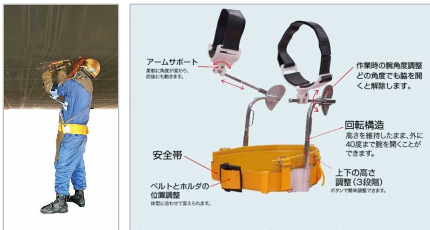
上向き作業用アシストスーツ