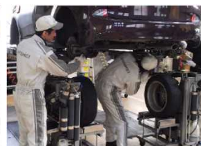
(技能実習生と共に作業)