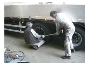
(整備作業中の風景)