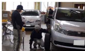
(女性事務職員への社内研修)

インターンシップの積極的な受け入れや子供を対象としたイベントの年3回開催、自動車整備のアピールのための近隣の中学生の職場体験の受け入れ、外国人実習生の雇用、女性整備士のため職場環境整備を実施。